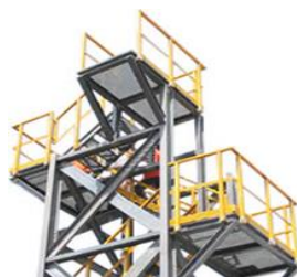
Estruturas, Plataformas e Guarda-Corpo